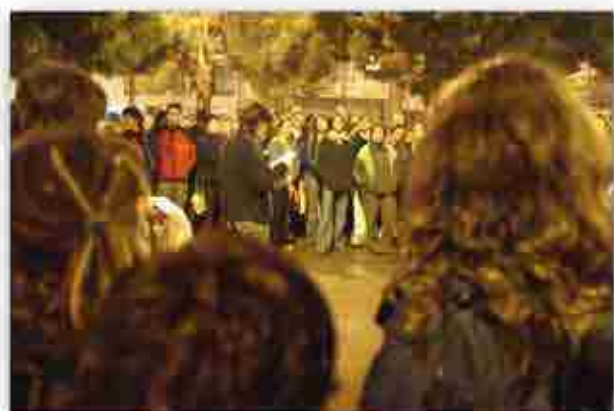
Concentració a la plaça Marçat.