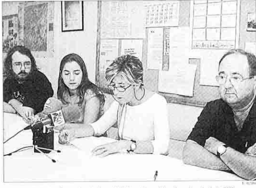
Miembros de la plataforma durante la rueda informativa celebrada en la sede de la FAV

Los miembros de la 'Plataforma de apoyo a los 11 detenidos' ratificaron ayer que la Policía cargó contra los jóvenes del bar Bemba sin motivo y que ninguno de los arrestados reconoce su culpa en los destrozos que se cometieron en el centro histórico de la ciudad.