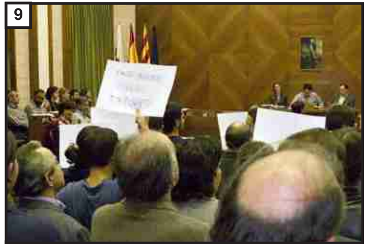
Els polítics es reuneixen: això és un Ajuntament! Primer la policia... i després l'altra gent.