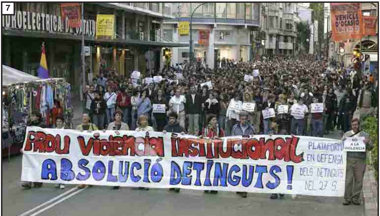
Però Sabadell no calla, i tota una munió surt als carrers a cridar: Volem l'absolució!