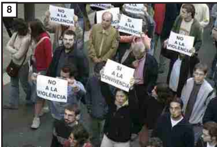
Si voleu una ciutat on regni la convivència, polítics i policies: Ja n'hi ha prou de violència!