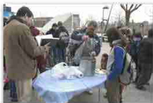
Concentració davant dels jutjats.