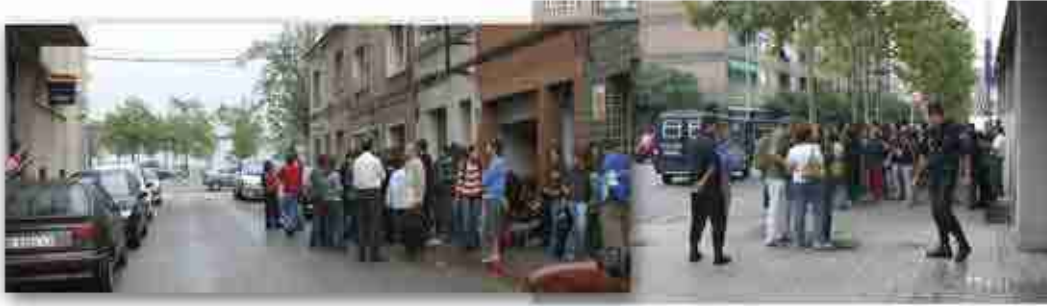
27-9-03 Concentració davant de la comissaria i dels jutjats